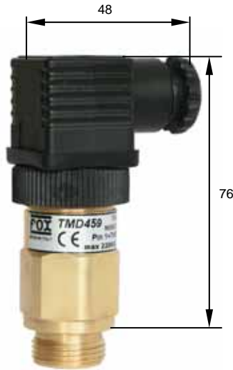
Con tenuta DIN integrata With integrated DIN seal

N.B. : Per entrambi i contatti indicare se NC o NA